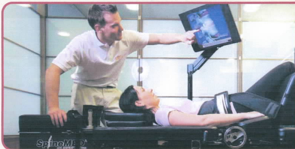
Spinale Dekompression mit dem SpineMED® Table